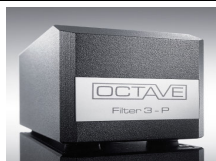
FILTER 3-P (RCA o XLR)

filtro passivo per connessioni di segnale analogico RCA o XLR