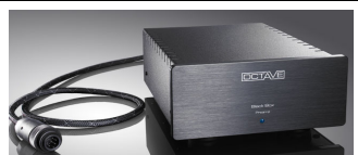
Black-Box PRE AMP

stabilizzatore di alimentazione esterno per Phono Module