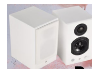
KIN PLAY MINI